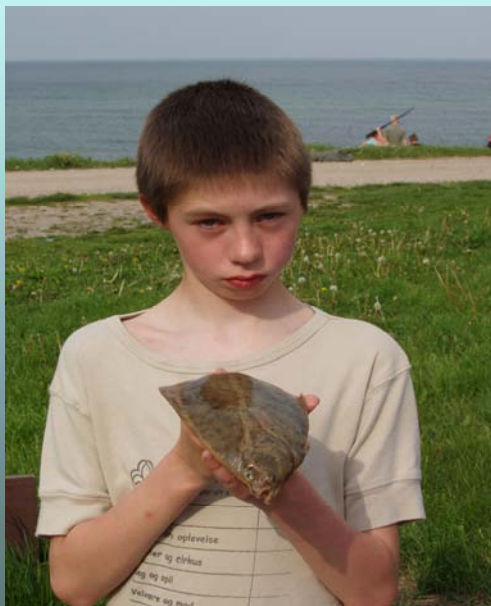
Han kan også fange fisk.