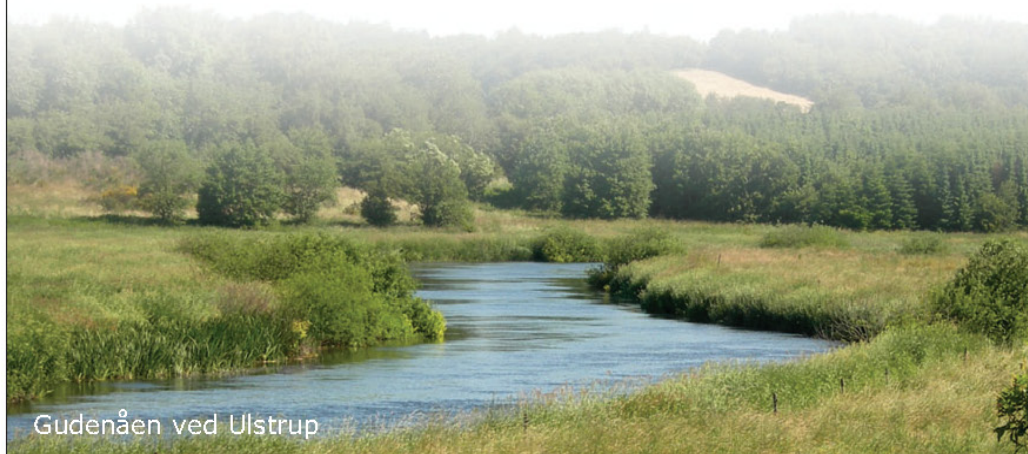
Gudenåen ved Ulstrup