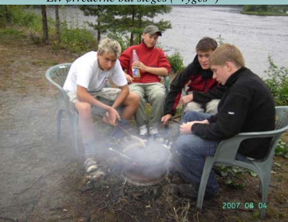
Elv ørrederne bål steges ("ryges")

Om eftermiddagen vadede vi ud på en ø som lå midt ude i elven. Fra øen kunne man fiske en god rende af, men vi fangede ingen laks derfra men vi fangede til gengæld nogle rigtig pæne elvørreder på 30cm, dem tog vi med ind og grillede dem til eftermiddags mad.