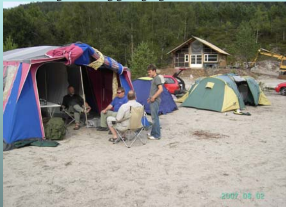
Lejren efter opstilling

Da vi kom hjem til campingpladsen var vi så spændte på at komme ud at fiske, så vi pakkede straks stængerne ud og gik i gang.