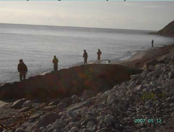
Aftenfiskeri ved Gjerrild. Der er gang i stængerne.

Der var i år en dejlig stor tilslutning, med 13 juniorer, og 5 voksne til at passe på dem.