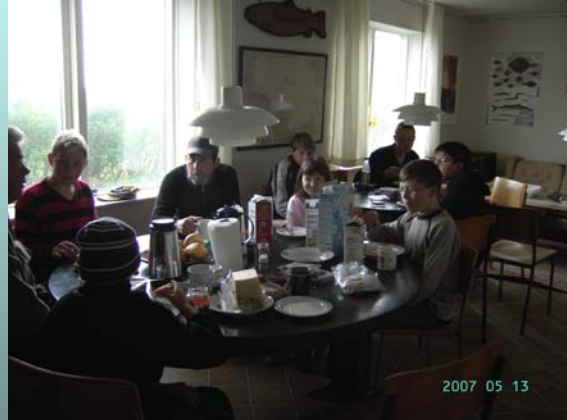
Morgenmaden indtages i huset, de morgenfriske har været ude at fiske første gang.

Lørdag morgen var mange ude at fiske kl. 04.00. Om søndagen var der ikke den samme energi, og der blev sovet længe til 08.30.