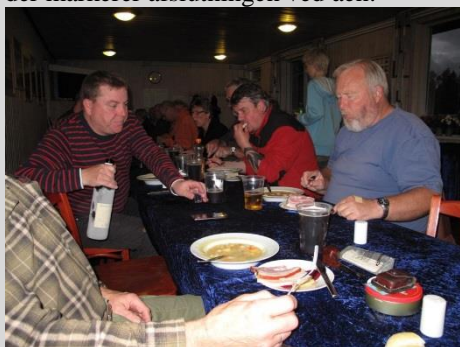
Og Jørgen var tørstig!

Her lidt stemningsbilleder fra vores 'gule ærter arrangement', lørdag d. 26-10 2013, der markerer afslutningen ved åen.