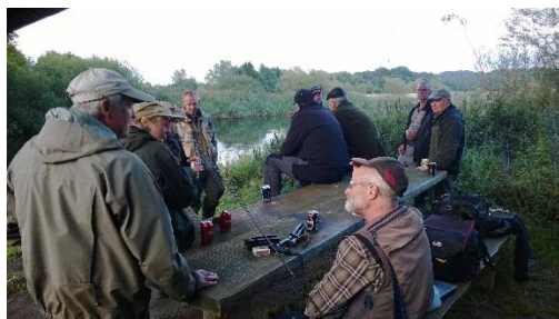
Fredags hygge mellem broerne.

Gudenåkonkurrencen 2013 blev afholdt den tredje weekenden i september. Et fantastisk flot september vejr. Høj sol og behagelig temperatur gør at de laks som har manglet i hele sæsonen for alvor er på vej i åen. Temaet for konkurrencen er altid at sætte fokus på de fantastiske fiskeri som hvert år skaber store overskrifter i alle tidskrifter i ind og udland som omtaler Gudenåen.