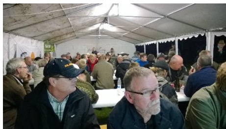
Fulde telte fredag aften.

367 deltagere nød Gudenåens smukke nær-område hvoraf de 150 deltog det store aftenarrangement med helstegt gris og gave-regn fra sponsorer og samarbejdspartnere til en samlet værdi på over 20.000 Kr. Aftenarrangementet er det som får konkurrencen til at blive en helhed med højt humør og det glæder os som arrangør at tilslutningen bliver større for hvert år.