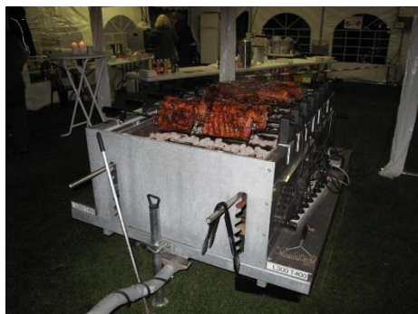
Mad på grillen.

Det betyder at det økonomiske resultat bliver det største nogensinde nemlig over 80.000 Kr.