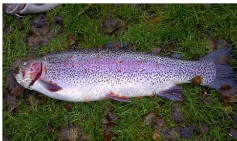
Flotte fisk med hele haler.

Desværre ville skæbnen at natten til lørdagen med Put & Take turen, var den første nat ned nattefrost. Så går fiskene lidt i dvale og er lidt svære at lokke til at bide.