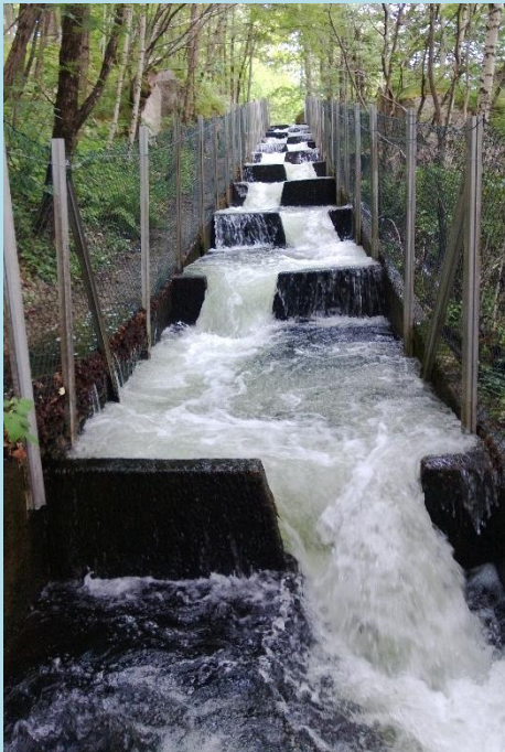
Norges svar på en fisketrappe ved Tange.