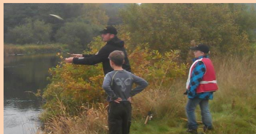
Der fiskes efter en Gedde som har taget skallen 2 gange

Det blev så sidste kast for snøren sprang. Vi siger mange tak for besøget. Vi glæder os meget til at komme til Fyn maj 2014