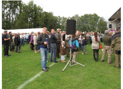
Mennesker på pladsen lørdag.

Samlet blev der indvejet 60 fisk hvilket er noget under det normale. Antallet er dog godkendt set ud fra lystfiskeriet af laks generelt i hele norden for 2013. De var fordelt på laks, havørreder + gedder og andre arter som tillades for de unge juniorfiskere.