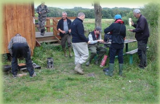
Hygge fredag aften.

Traditionen tro var der kortsalg fra smedens eng. Hvor man også senere kunne fristes med pølser, lunkne øl og vand samt slik. Til en lille snak om hvor Laksen mon var henne . For den var ikke i vandet som nogen påstod.