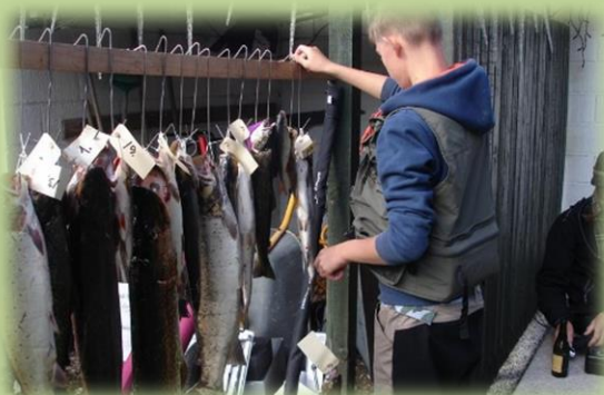
Fangsten hænges op.