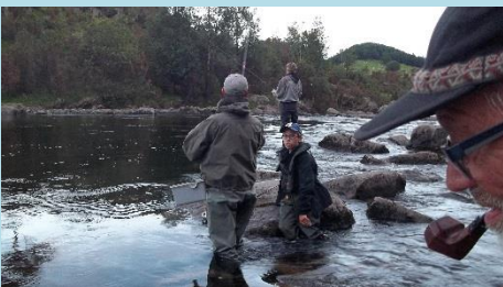
Der fiskes. Hvem mon ryger på piben?