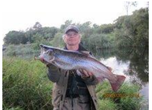
Desværre henvist til 2. præmie havørred.