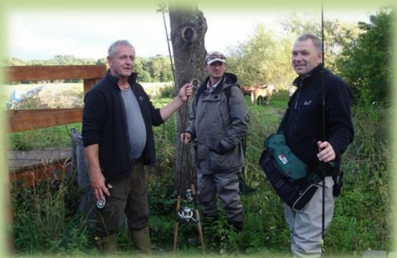
Lystfiskere forstår at hygge.