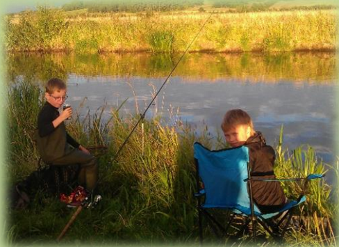
Morgen fiskeri neden for hytten.