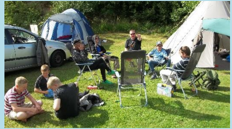
Der hygges i lejren.