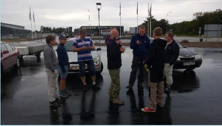
Hirtshals og store forventninger.

Den 8. til den 11. august, var juniorerne på tur til Bjerkrims Elven.