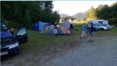
Lejren sættes op.

Vi var 11 der tog afsted. 6 juniorer, 2 forældre og 3 juniorledere.