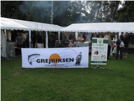
Telt pladsen på Langå Stadion. Med røg fra grillen.