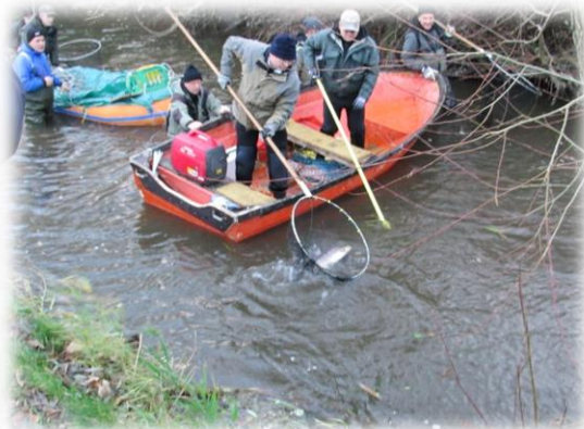
Så var der bid.

Da medlemmerne i Hadsten-foreningen ikke har haft det bedste fiskeri på deres fiskevand i år, var det spændende at se, om fiskene havde indfundet sig her sidst på sæsonen. Ret hurtigt stod det dog klart, at det havde de, og fiskene væltede op hele vejen ned gennem parken.