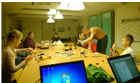
Der bindes fluer til Put & Take turen.

Mød op på disse aftner , også selv om du ikke mangler noget. Det er altid hyggeligt.