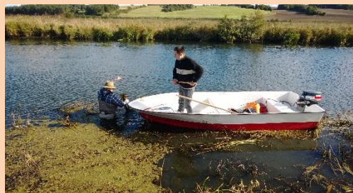
Gedden hjælpes i land.