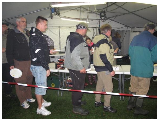
Så er der mad i teltet.

367 deltagere nød Gudenåens smukke nær-område hvoraf de 150 deltog det store aftenarrangement med helstegt gris og gave-regn fra sponsorer og samarbejdspartnere til en samlet værdi på over 20.000 Kr. Aftenarrangementet er det som får konkurrencen til at blive en helhed med højt humør og det glæder os som arrangør at tilslutningen bliver større for hvert år.