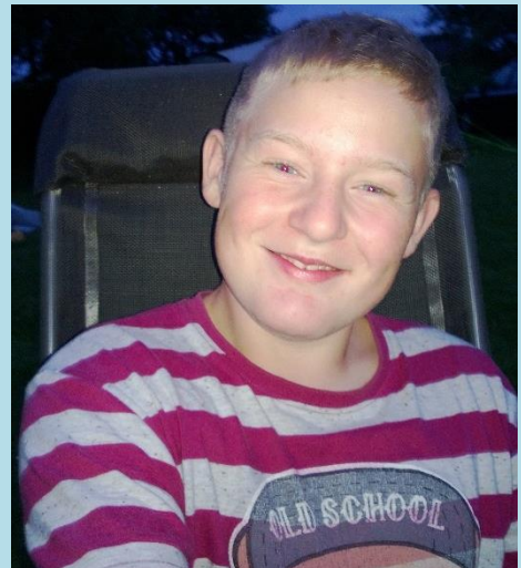
Et glad selprotræt, selvom man ikke fanger noget.