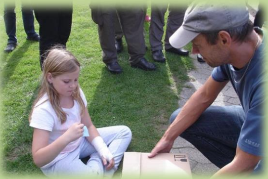
Notarius publicus foretager lodtrækningen.

Da der ikke blev fanget nogle laks, som der er hændt for rigtig mange i år, blev de flotte præmier udtrykket på deltagerbeviset.