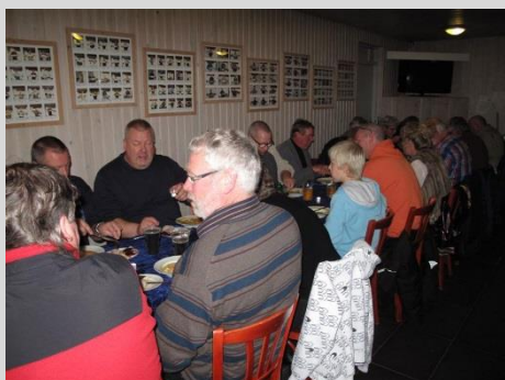
Der fortælles røverhistorier!