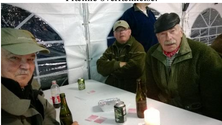
Hygge i teltet = Øl på bordet.