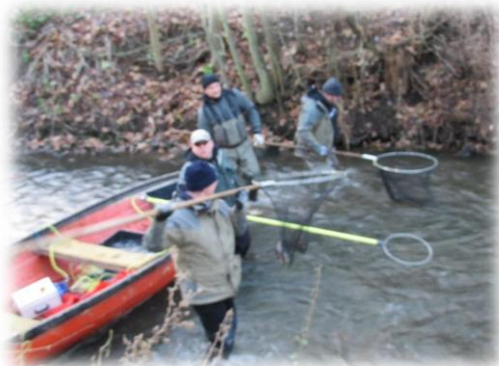
Klar til at fange fisk.

Lørdag d. 1-12 2013 fandt årets el-fiskeri sted i Lilleå-parken i Hadsten.