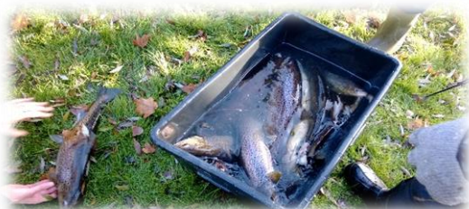
Sprælle kan de også