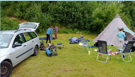
Der pakkes stadig ud.