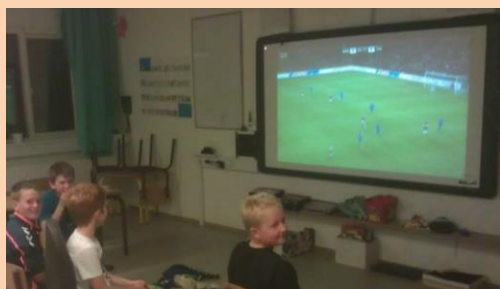
Der ses fodbold i klasseværelset på Langå skole.

Den 11. oktober kom vores venner fra Fyn med deres juniorer. Det var samme aften hvor Danmark spillede den afgørende kamp frem mod VM Der var forlangt fodbold ved ankomsten. Som gode værter blev det selvfølgelig klaret