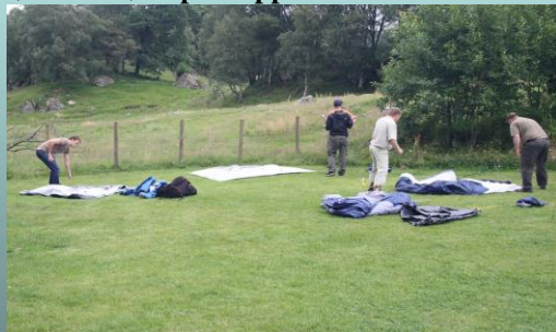
Telt lejr før rejsning.

Der er begrænset pladser så det er efter først til mølle princippet.