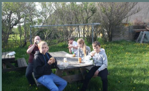
Formiddags afslapning efter morgenfiskeri.

Vi skal have kyllinger, med ris og flute til.