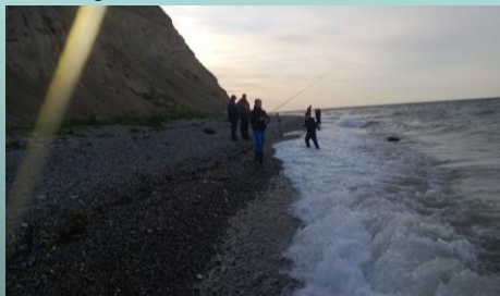
Fredag aften, på stranden.

I skrivende stund, er vi i Gjerrild, på juni-or fisketur. Vi kom i går aftens. Det blæste en del, hvilket vanskelig gjorde kystfiskeriget en del, for børnene. Fangsten fredag begrænsede sig til en hornfisk til undertegnede.