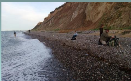
Fredag på kysten i Gjerrild.