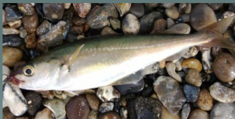
Små sej, som dog alle blev genudsat.

I dag lørdag, er fiskeriget lidt lettere. Det er blevet til 5 hornfisk, en havørred under målet. Samt en det små sej, som går helt inde under land.