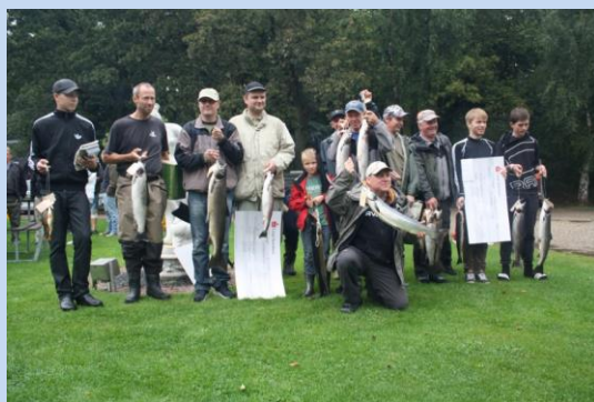
Billeder fra medlemskonkurrencen 2012

Kortsalg fredag fra 18-20.00 ved Smedens eng.