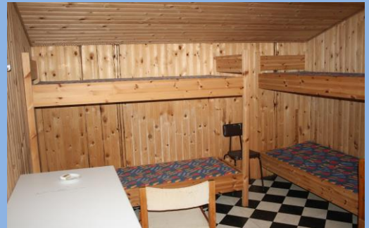
Køjesenge i aneget.

Der er 4 køjesenge + sofa i huset, samt 4 køjesenge i aneget, som ses her under.