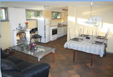
Stuen, med køkkenet i baggrunden.

Tilfreds med huset. Med bemærkninger om følgende mangler. En grill, stort spækbræt, og en radio. De to første ting er der rådet bod på, så skulle en af jer ligge inde med en radio i ikke har brug for, modtager vi den gerne.