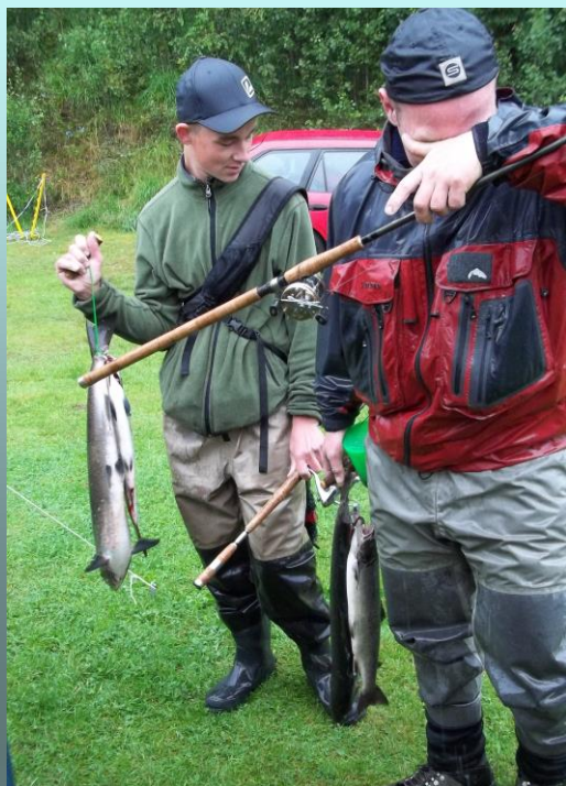
Billede fra sidste Norgestur 2011

Vi prøver igen med at lave en dejlig en tur til syd Norge, for at fiske laks.