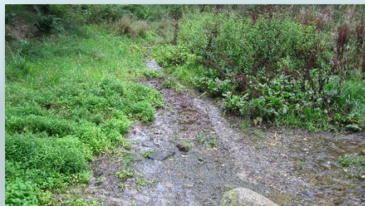
Gudenåens spæde start ved Tinnet.

Husk det er også her på deres side I skal registrere jeres båd, hvis I vil sejle på Gudenå systemet.