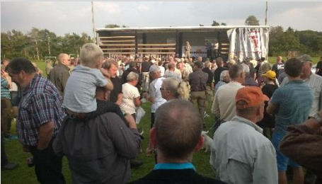
Folk på pladsen lørdag.

Som alle ved har det været en svær sæson. Det samme gjorde sig gældende under konkurrencedagene.