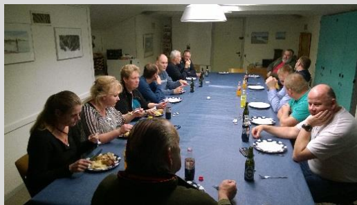
Hjælperne til eftergilde.