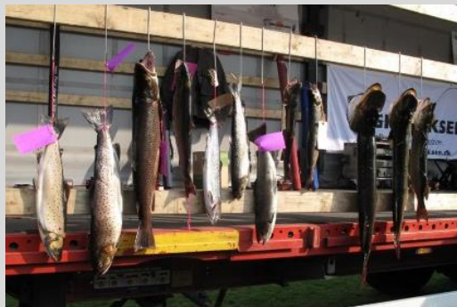
Den samlede fangst.

Det fine vejr og den - tilsyneladende - sparsomme opgang af laks i år afspejlede sig da også i fangsterne fra Gudenåen. De svære forhold gjorde det også vanskeligt i Lilleåen!