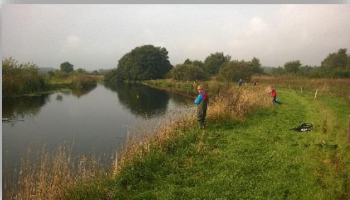
Junior på fisketur ved Husmandsbrinkerne.

Vores gennemgående emne på klubaftenerne, vil være bygning af fangstnet. Vi har indkøbt materialerne, og skulle kunne begynde straks.