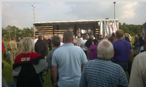
Masser af folk ved præmieoverrækkelsen.

Lørdag ca. kl 16.15 var der præmieuddeling med Grejbiksen som hovedsponsor, men også Langå Camping, F.C spinner, Randers Jagt og fiskeri, Bøssemageren i Bjerringbro, Lystfisk.dk samt Jafi i Viborg var blandt sponsorerne.