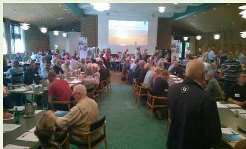
Billede fra selve salen.

Jeg havde den fornøjelse at repræsentere FFFD (Ferskvandfiskeri Foreningen For Danmark). Vi var der stort set med hele bestyrelsen. Det var en meget interessant konference for os med interesse for lystfiskeri.