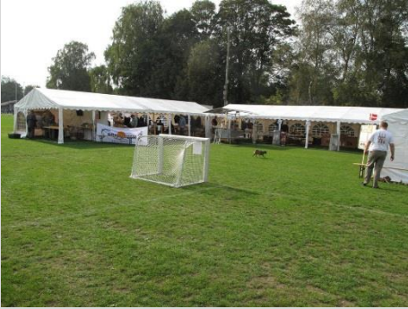
Den flotte plads på Langå Stadion.

Som alle ved har det været en svær sæson. Det samme gjorde sig gældende under konkurrencedagene.