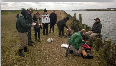
Fra en kold tur til Fjorden, men varme pølser.

I bededagsferien, 30. april til 3. maj, er der som sidste år, tur til Nyborg. Her kan alle selvfølgelig også deltage. Sidste år var der jo en super fangst, så det håber vi jo at kunne gentage.