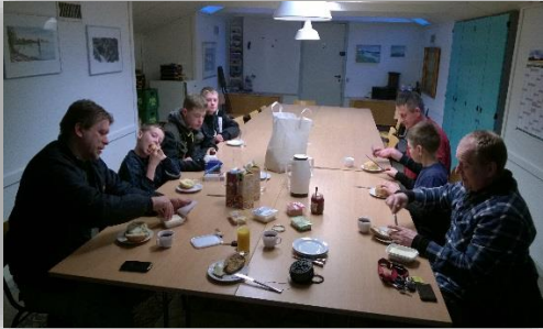
Morgen mad inden fisketur.

På næste side finder i juniorkalenderen for den kommende sæson. Vi har lagt lidt flere fisketurer ind. Vi håber at nogle flere vil deltage i dem. Det er ikke en betingelse at I kommer på junior aftenerne, for at komme med på fisketurene. Forældre må gerne deltage i tuerne hvis i har lyst.