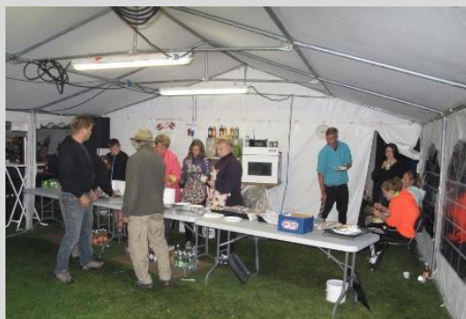
Så er der gris på grillen.

Til vinderne i henholdsvis lakse- og havørredklassen var der et gavekort på 5000 kr. sponsoreret af konkurrencens hovedsponsor "Grebiksen", mens juniorførstepladsen var et gavekort på 2500 kr. I alt var der en samlet præmiesum for 75000 Kr.!