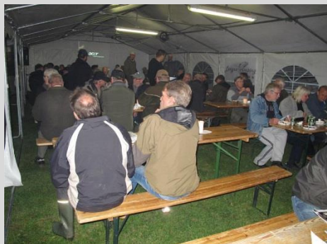
Spisning fredag aften.

Konkurrencen havde i år et deltagerantal på 274 - juniorer medtaget, hvilket er lidt under normalen, da der normalt er ca. 320-350 deltagere.