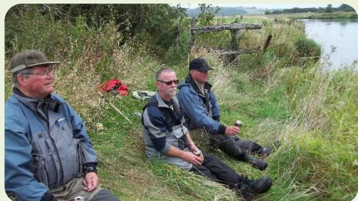
Der holdes øl pause i fiskeriet.

Traditionen tro holdt vi vores medlemskonkurrence de sidste fredag / lørdag i august.