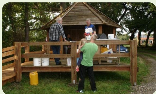
Der sælger pølser og billettet i smedens eng.

Det vil vi gerne takke jer alle for, overskuddet går jo ubeskåret til vores juniorforening.