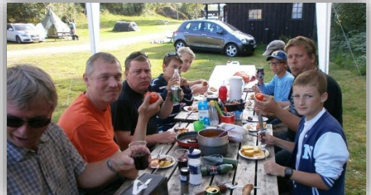
Morgenmad i Norge 2013.

I skal være født i 2002, eller før, for at være gammel nok til at komme med. Det gør vi for at alle skal kunne få noget ud af turen. Elvene i Norge kræver jo også lidt af fiskeren.