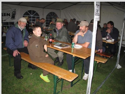
Glade ansigter, de smagte vist godt, grisene.

Efter indvejningen og præmieuddelingen kl. ca. 16.15 var det atter tid til nedtagningen af de opstillede telte, borde mv., og enden på en fin konkurrence nået.